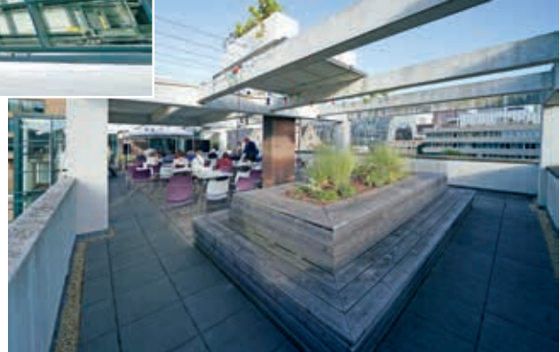
Houten zitmeubel op het 'rode'terras'.

die onder het podium van de grote zaal komt. Dit project blijft proefondervindelijk verbeterd worden, op gebied van gebruik, slim waterbeheer, inrichting en beplanting. Het ontwerp is zodanig dat de daken zich kunnen blijven aanpassen aan de toekomstige functies van het gebouw.