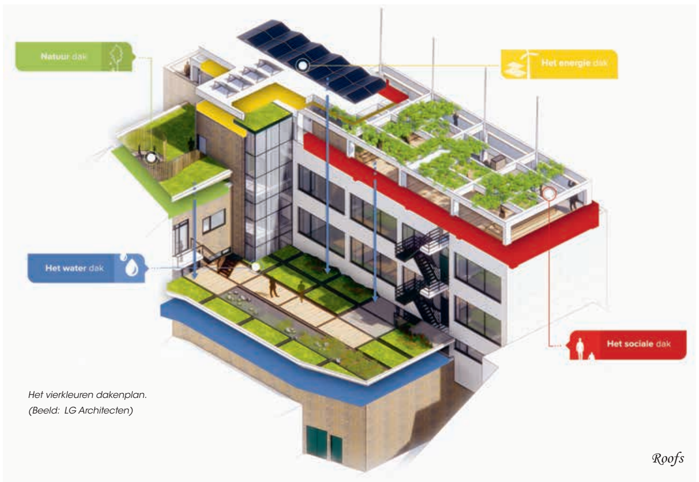
Het vierkleuren dakenplan. (Beeld: LG Architecten)

Alleen voor het blauwe dak was een constructieve ingreep nodig. Aannemer OK Bouwprojecten heeft hier op grond van berekeningen van RoyalhaskoningDHV de vloerconstructie aan de onderkant versterkt met stalen spanten.