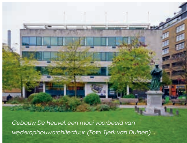
Gebouw De Heuvel, een mooi voorbeeld van wederopbouwarchitectuur.

Voor de invulling van het blauwe en rode dak heeft Horti Verde de ontwerpen gemaakt die door Dolmans Landscaping group zijn uitgevoerd. Het rode dak is al enige jaren een fraai decor voor evenementen en concerten. Daartoe is het grote terras voorzien van een vlondervloer op houten dragers met daaromheen tegels (60 x 60 cm) op tegeldragers en een smalle strook grind als randzoom. Van hout zijn ook diverse plantenbakken en een zitmeubel annex plantenbak gemaakt. Retentiekraften zorgen voor de waterberging.