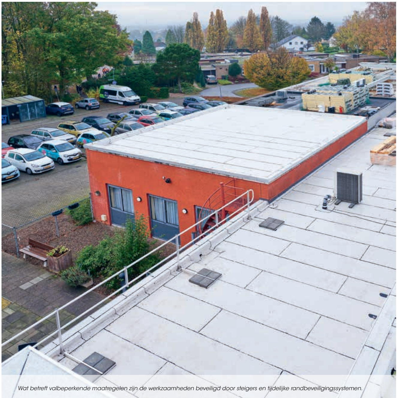
Wat betreft valbeperkende maatregelen zijn de werkzaamheden beveiligd door steigers en tijdelijke randbeveiligingssystemen.

De toepassing van het IKO Eco-concept is een keuze voor duurzaamheid geweest. De gunstige effecten van de reflecterende dakbedekking op de onderliggende ruimte en de dakconstructie gaf de doorslag. De isolerende werking van het dak is sterk verbeterd en men overweegt ook zonnepanelen op het dak toe te passen.