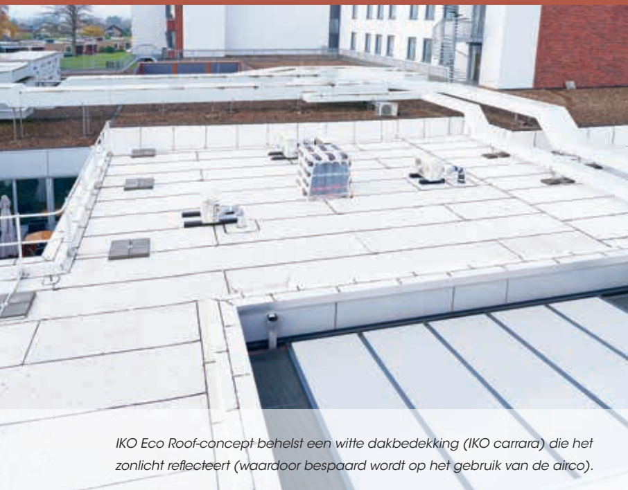
IKO Eco Roof-concept behelst een witte dakbedekking (IKO carrara) die het zonlicht reflecteert (waardoor bespaard wordt op het gebruik van de airco).

Vanwege enkele minder geslaagde ingrepen in het verleden vertoonde het dak van verpleeghuis De Dormig in Landgraaf lekkages. Besloten werd de volledige dakopbouw te vervangen door het concept IKO Eco Roof. Daarmee werden de technische problemen op de in totaal acht dakvlakken verholpen en bovendien werd het dak verduurzaamd.