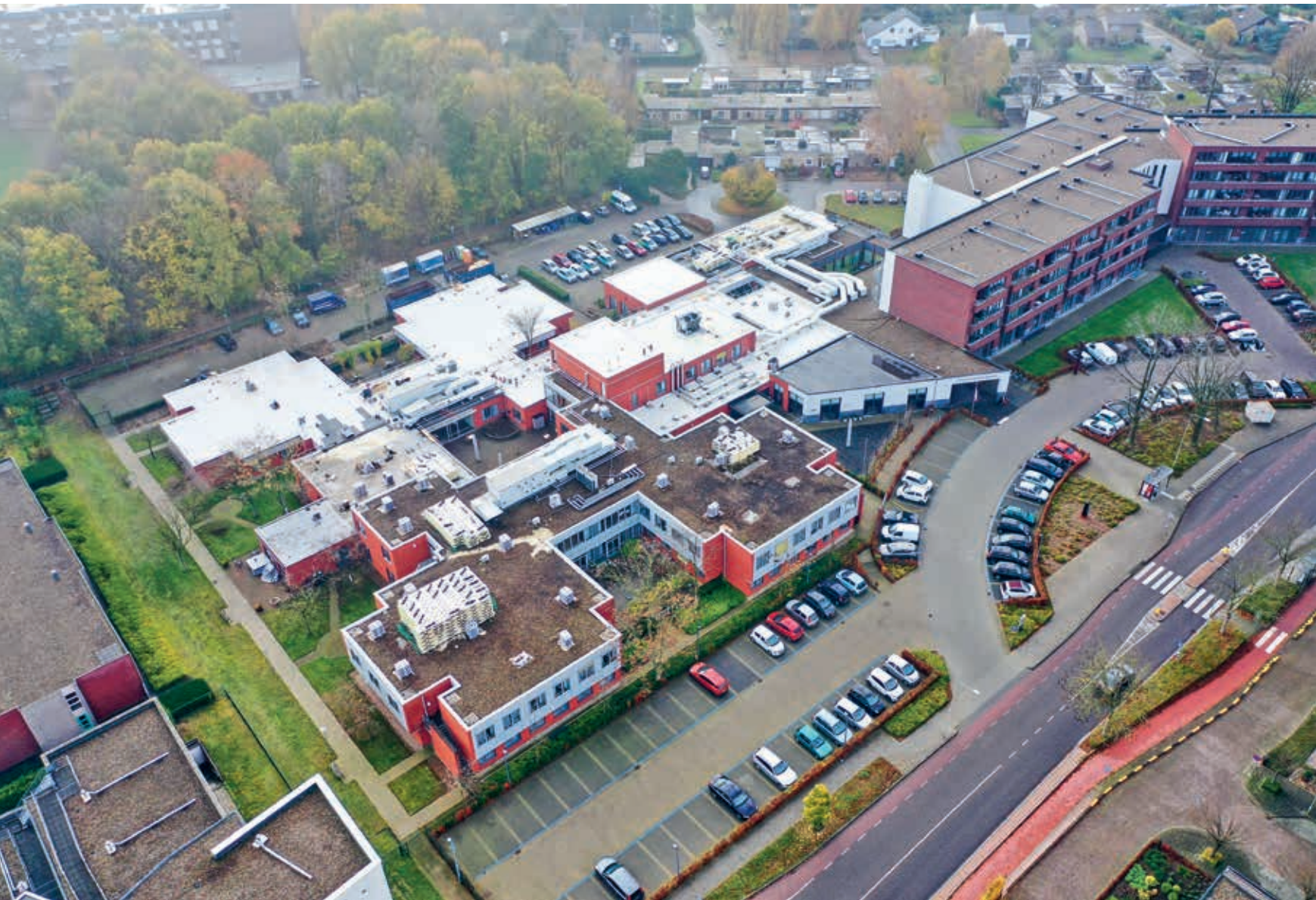
Verpleeghuis De Dormig in Landgraaf is een locatie van de Meander Zorggroep.

worden door de regen. Dit resulteert in een aantoonbare verbetering van de luchtkwaliteit. De dakbedekking is voorzien van een DUBOkeur van NIBE.